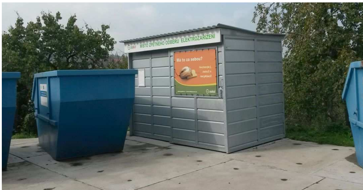
Foto: Sběrný dvůr, elektro-domek

Z důvodu nevyhovujícího stavu odvádění odpadních vod byla provedena oprava kanalizace na trati Drahy – Podkoryta a dále bylo provedeno vyčištění cesty ke „Včelínu“. Práce na vyčištění cesty prováděli zaměstnanci obce. V letních měsících tohoto roku se také provedly částečné opravy místních komunikací a oprava dešťové vpusti s rozšířením vozovky v místní části Drahy.