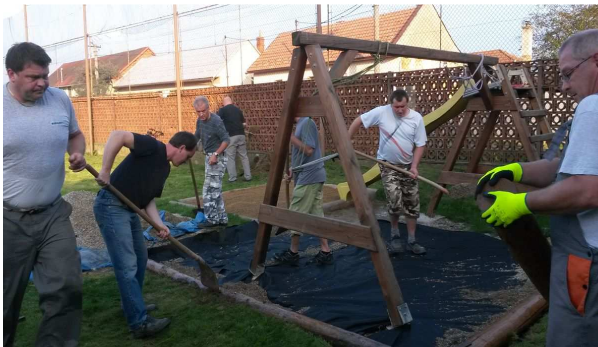
Foto: Budování dětského mini-hřiště

Poděkování patří i složce, která není organizovaným spolkem. Zasloužila se o uspořádání několika akcí jako je pomoc při dětském karnevalu, pořadatelsví Svatomartinských hodů, a také vybudování dětského mini-hřiště a to z vlastních prostředků. Podíleli se také na několika brigádách u víceúčelového hřiště. Nesmíme také zapomenout na spontánní dobrovolné akce při darování krve.