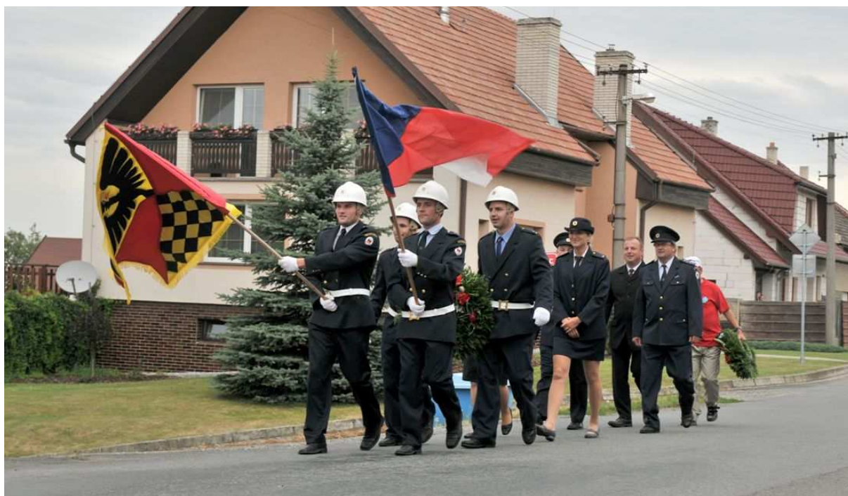
Foto: Oslavy 110. výročí založení SDH v obci

Poděkování patří celému sboru dobrovolných hasičů Nová Dědina za reprezentaci obce při soutěžích v požárním sportu, práci s dětmi, pořádání akcí např. Strašidelný les, dětský den, stavění a kácení máje, živý Betlém, Mikulášská pochůzka, Masopust a udržování dalších tradic v obci. V roce 2012 sbor uspořádal významnou oslavu u příležitosti 110. výročí založení sboru dobrovolných hasičů v Nové Dědině.