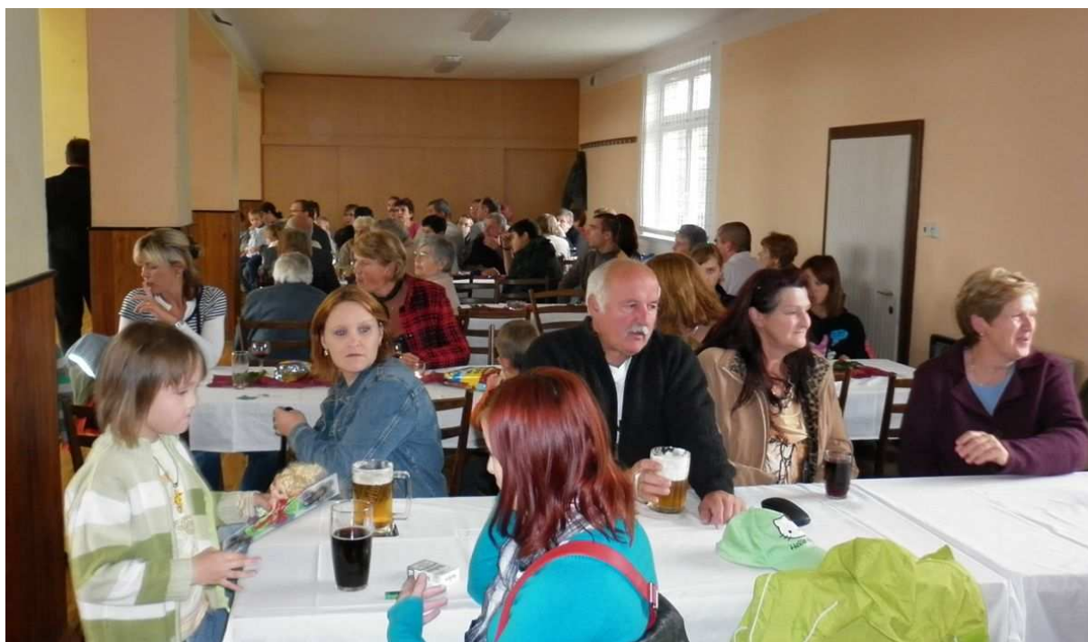
Foto: Oslava 355. výročí založení obce v místní sokolovně

V roce 2011 jsme si také připomněli 355. výročí založení obce. U příležitosti tohoto výročí byla uspořádána oslava s živou hudbou, bohatou tombolou a výborným srnčím gulášem. V místní knihovně se vystavovaly kroniky obce i kroniky z místní školy, dobové fotografie a filmová ukázka ze soukromého archivu z let 1959-1962.