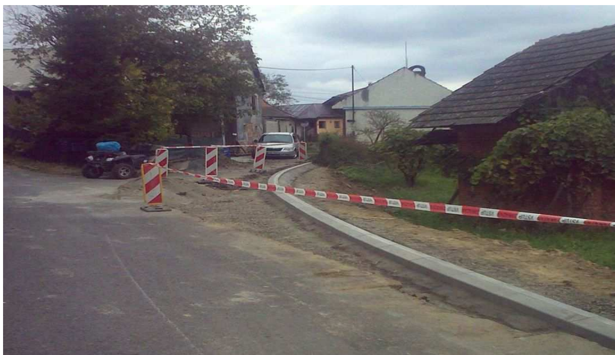
Foto: Oprava komunikace v místní části Drahy

Z důvodu nevyhovujícího stavu odvádění odpadních vod byla provedena oprava kanalizace na trati Drahy – Podkoryta a dále bylo provedeno vyčištění cesty ke „Včelínu“. Práce na vyčištění cesty prováděli zaměstnanci obce. V letních měsících tohoto roku se také provedly částečné opravy místních komunikací a oprava dešťové vpusti s rozšířením vozovky v místní části Drahy.