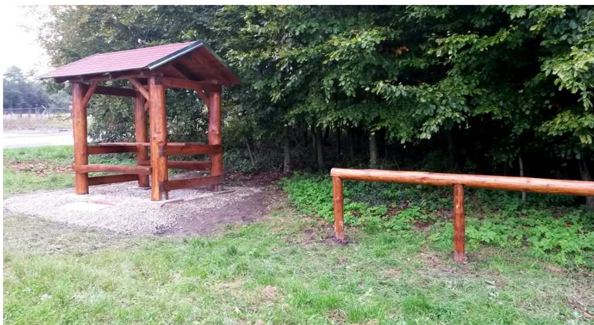
Foto: Odpočívadlo u lesa

Od tohoto roku je naše obec členem Místní akční skupiny Hřibčcí hory. MAS je zjednodušeně řečeno dalším možným nástrojem pro čerpání dotací v naší obci. Prvním drobným projektem je dřevěné odpočívadlo na kraji obce u výjezdu na Tabarky. Doufáme, že pokud bude tato MAS doporučena k financování, bude mít naše obec možnost čerpat peníze z některých dotačních titulů.