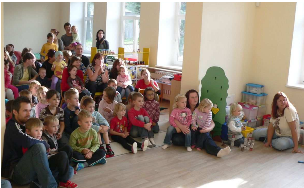
Foto: Slavnostní otevření rekonstruované mateřské školy

2014 proběhla pracovníky fondu fyzická kontrola hřbitova a všech dokladů k dotaci, po níž v dubnu 2014 obec obdržela finanční dotaci ve výši 2 565 568,- Kč. Podíl obce činil 1 011 763,- Kč. Celkové náklady činily 3 577 331,- Kč. Jsme přesvědčeni, že náš hřbitov je okrasou obce.