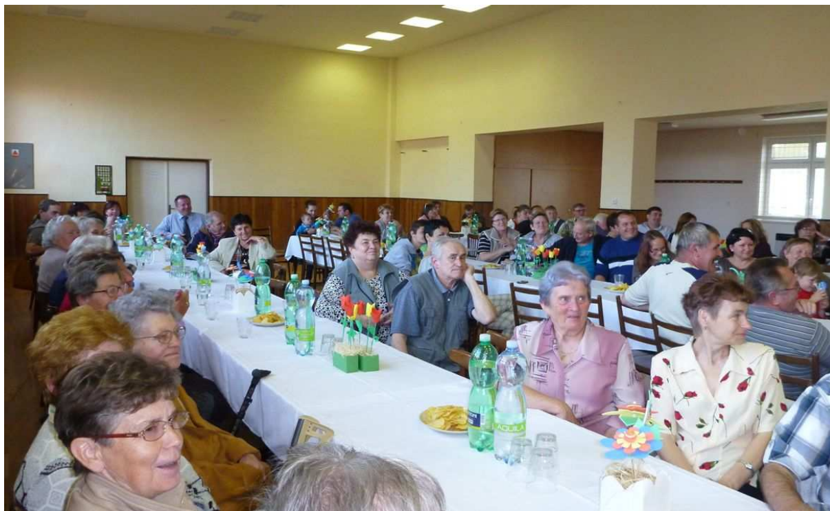
Foto: Den matek v místní sokolovně

Nezapomněli jsme také na pořádání akcí jako je Den matek, vítání občánků, rozloučení s předškoláky. Uspořádali jsme také dvě divadelní představení a vánoční koncert a již tradiční fotbalový turnaj O pohár starosty obce, který organizačně zajišťoval SDH Nová Dědina.