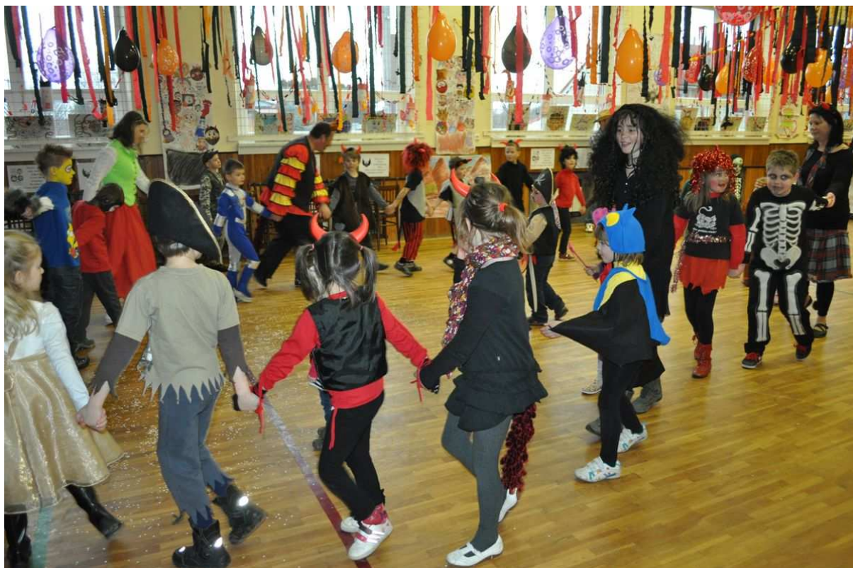
Foto: Dětský karneval