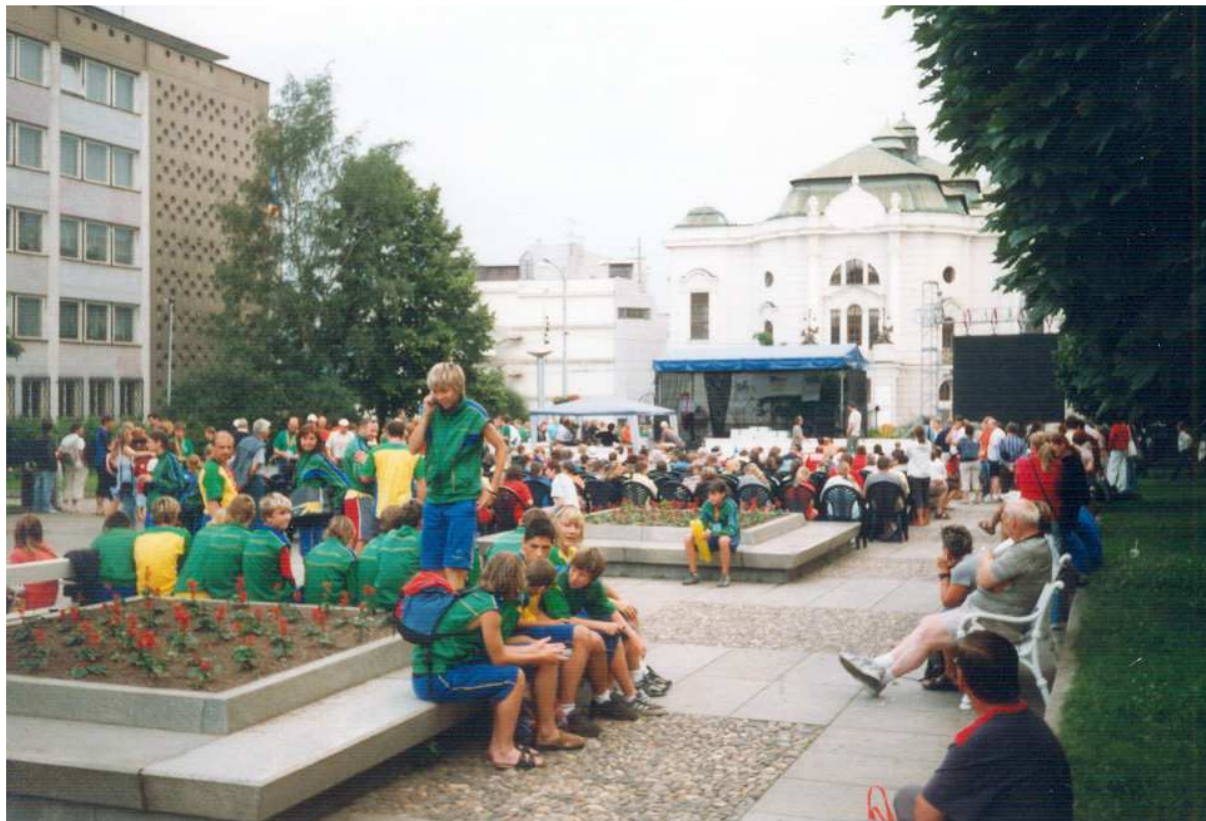
Na snímku je Lidické náměstí, na kterém se po skončení programu předávaly olympijské medaile. Vedle pódia hořel olympijský oheň.

Tyto hry se konaly ve dnech 19. – 24. června 2007 v Ústí nad Labem. Sportovci Zlínského kraje získali 9 zlatých, 5 stříbrných, 11 bronzových medailí a obsadili v bodování krajů 10. místo. Olympijský oheň zapálila Kateřina Neumannová.